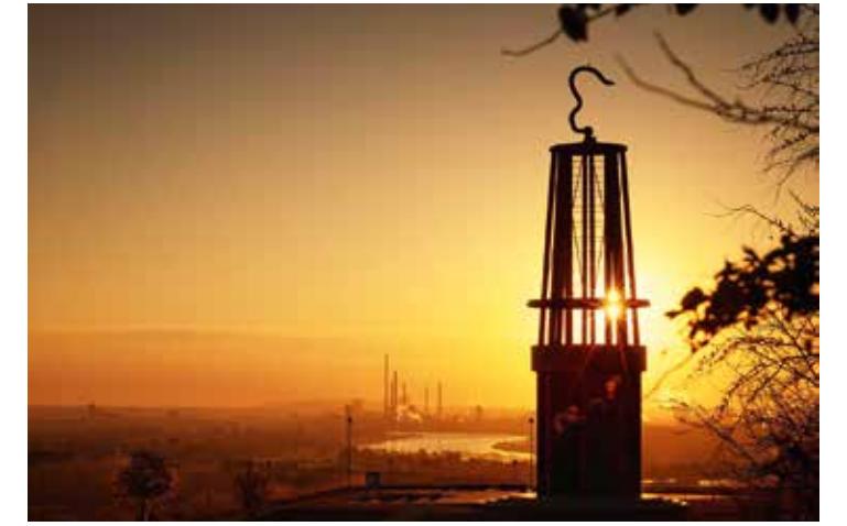
Die Installation „Das Geleucht“ auf der Halde Rheinpreußen, Moers