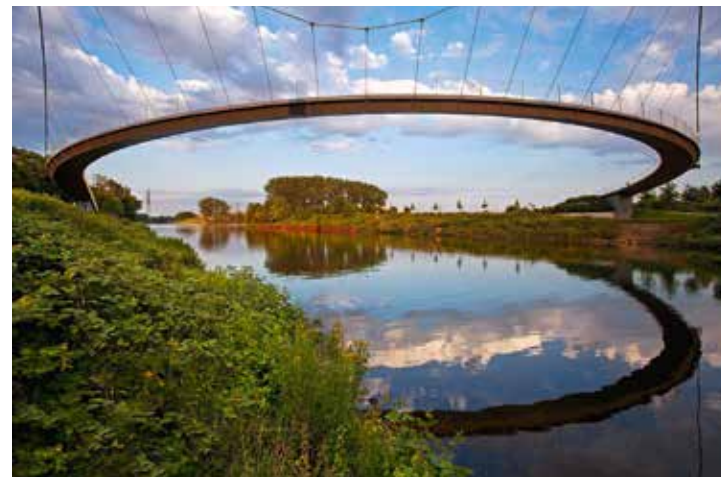
Die sogenannte „Grimberger Sichel“ über dem Rhein-Herne- Kanal, Gelsenkirchen