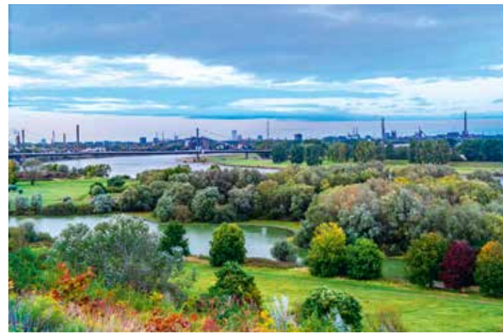
Blick über die Rheinlandschaft nach Norden, bei Duisburg