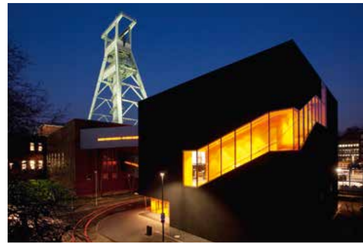
Das Deutsche Bergbau-Museum mit dem Erweiterungsbau „Schwarzer Diamant“, Bochum