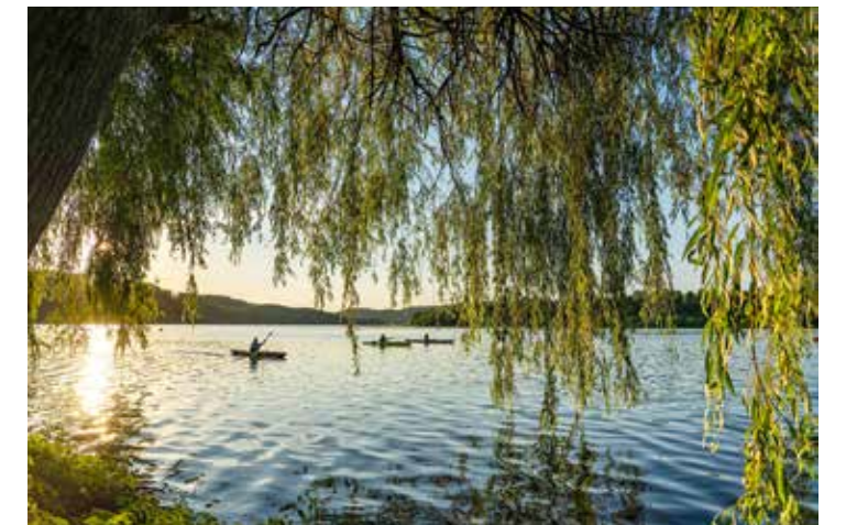
Kajaks auf dem Baldeneysee, Essen