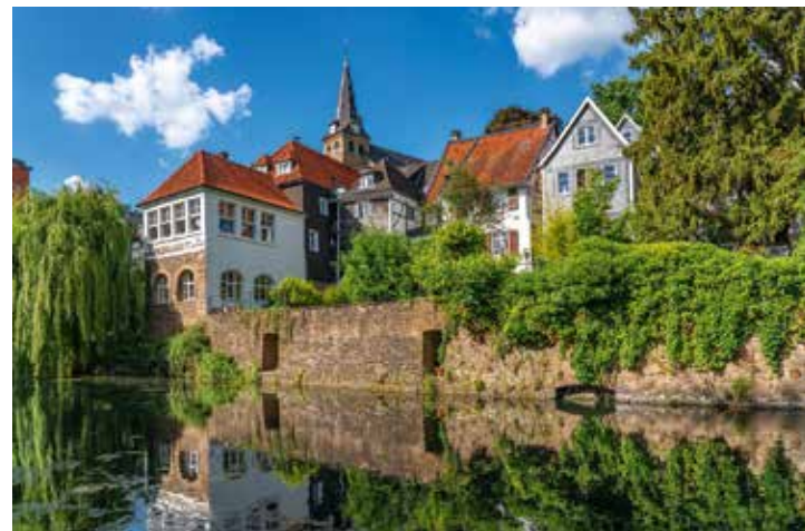
Die historische Altstadt Essen-Kettwig mit Mühlengraben