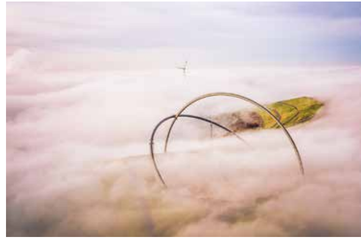
Das Horizontobservatorium auf der Halde Hoheward im Nebel, Herten