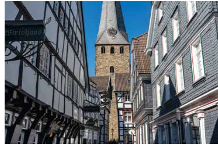
Die Altstadt von Hattingen mit der evangelischen Kirche St. Georg