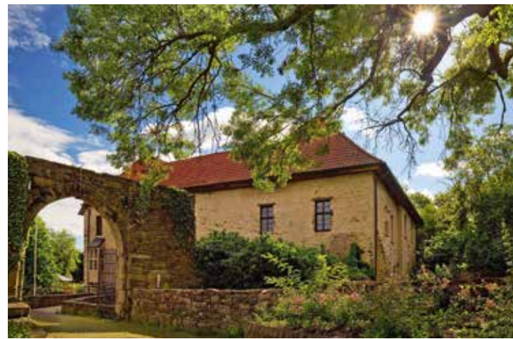
Haus Herbede, Witten