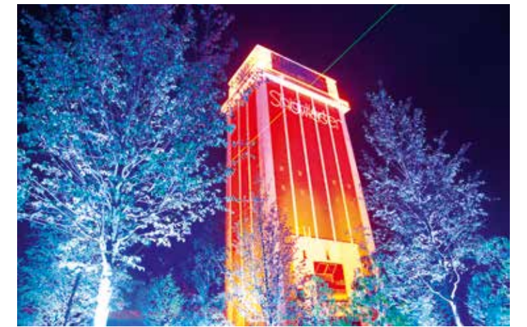
Illuminierter Förderturm über dem Schacht I der ehemaligen Zeche Friedrich Heinrich 1/2 während der Landesgartenschau 2020, Kamp-Lintfort