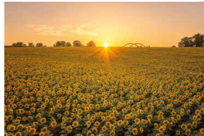
Sonnenblumenfeld, Datteln