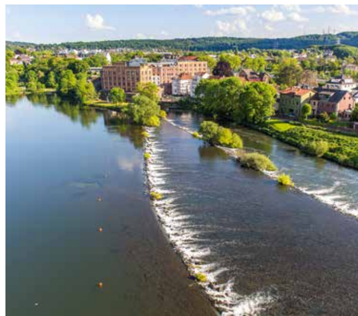
Staufstufe der Ruhr bei Hattingen, Birschel-Mühle mit Wasserkraftwerk

Noch mehr fantastische Ansichten unserer Region gibt es im Buchformat!