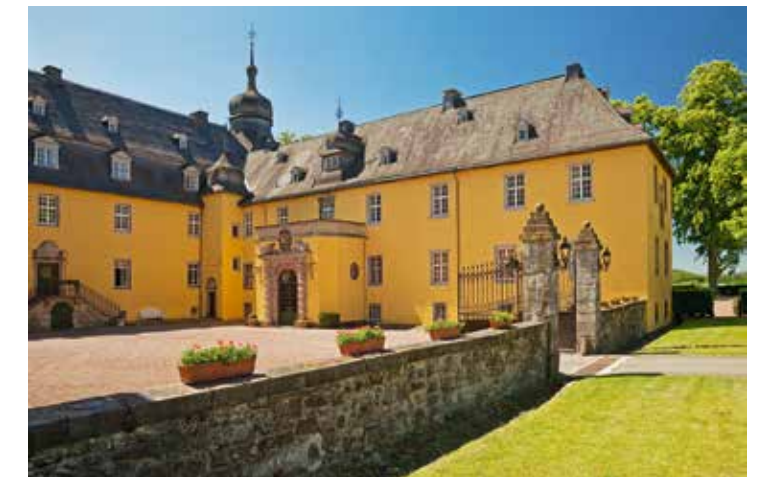
Schloss Melschede, Sundern