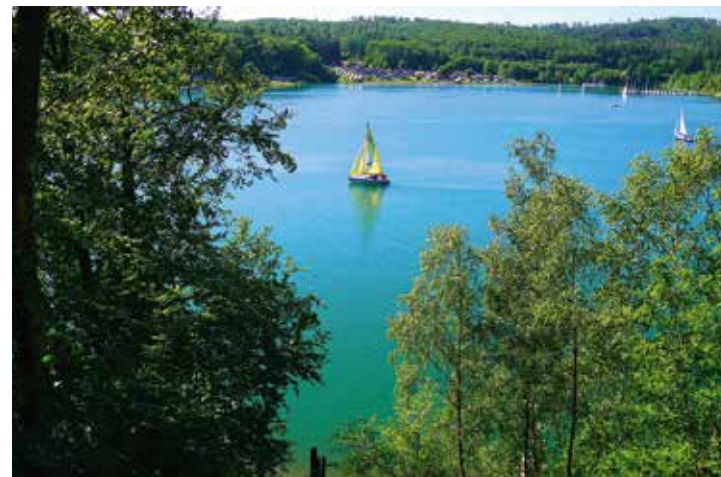
Sommerliche Idylle am Sorpesee