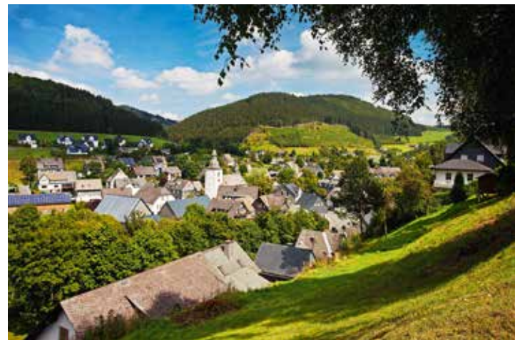
Schmallenberg, Ortsteil Oberkirchen mit der St.-Gertrudis-Kirche