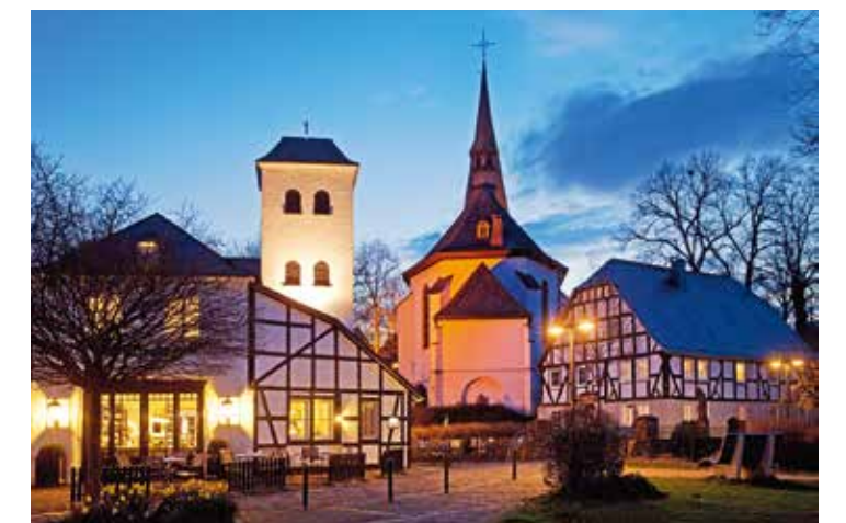
Fachwerkhäuser um die Pfarrkirche St. Peter und Paul, Eslohe