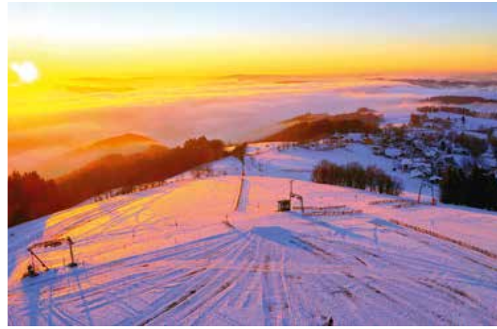
Sonnenuntergang über Wildewiese