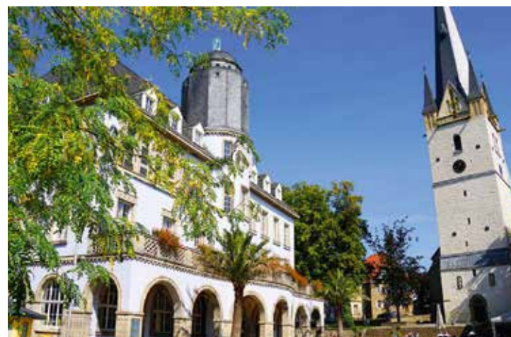
Das Alte Rathaus und die Pfarrkirche St. Vincenz in Menden