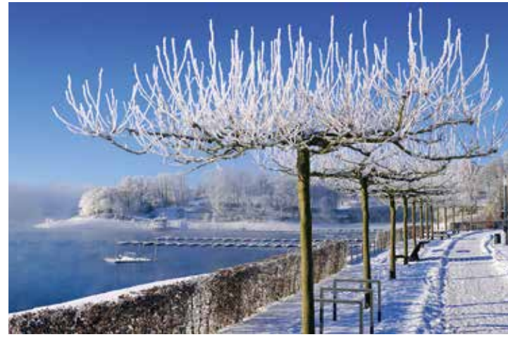
Winterstimmung an der Sorpesee-Promenade in Langscheid