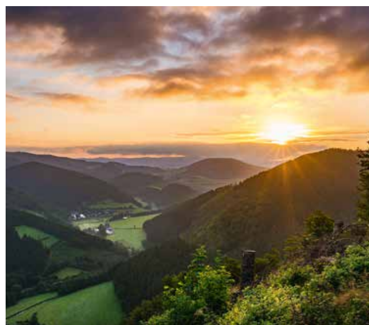
Sonnenaufgang auf dem Rossnacke über dem Lennetal, Lennestadt-Saalhausen

Noch mehr fantastische Ansichten unserer Region gibt es im Buchformat!