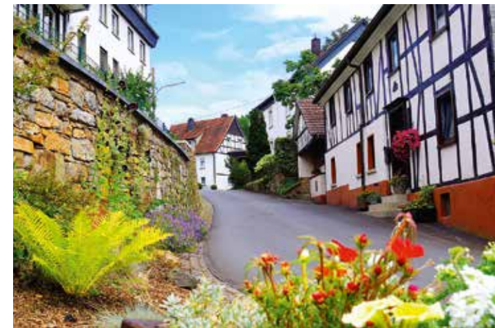
Die Dorfmitte vom Finnentropen Ortsteil Schönholthausen