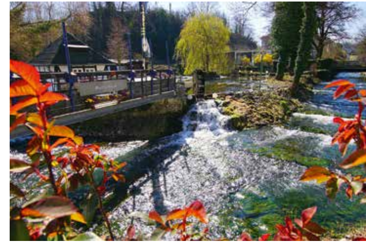
Der Bullerteich an der Wäster in Warstein