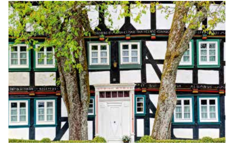
Historisches Fachwerkhaus in Menden