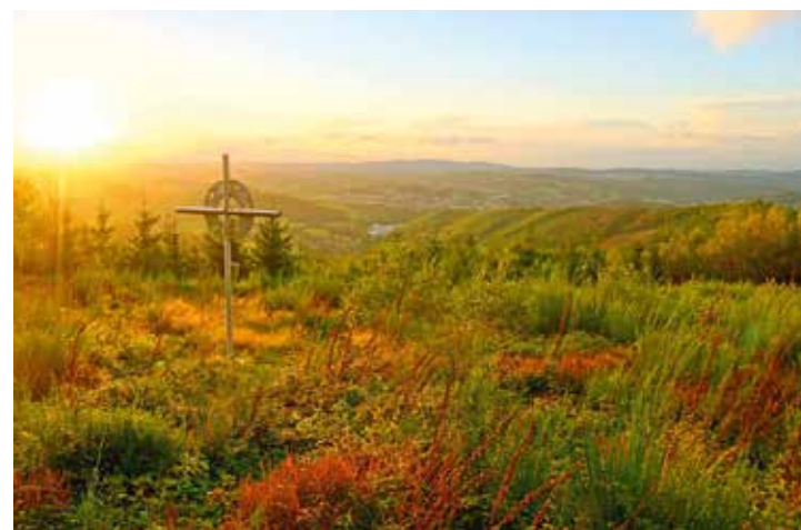
Panoramablick vom Dümberg auf das Sunderner Sauerland