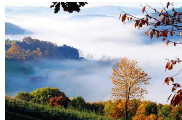
Herbststimmung über dem Wennetal bei Wenholthausen