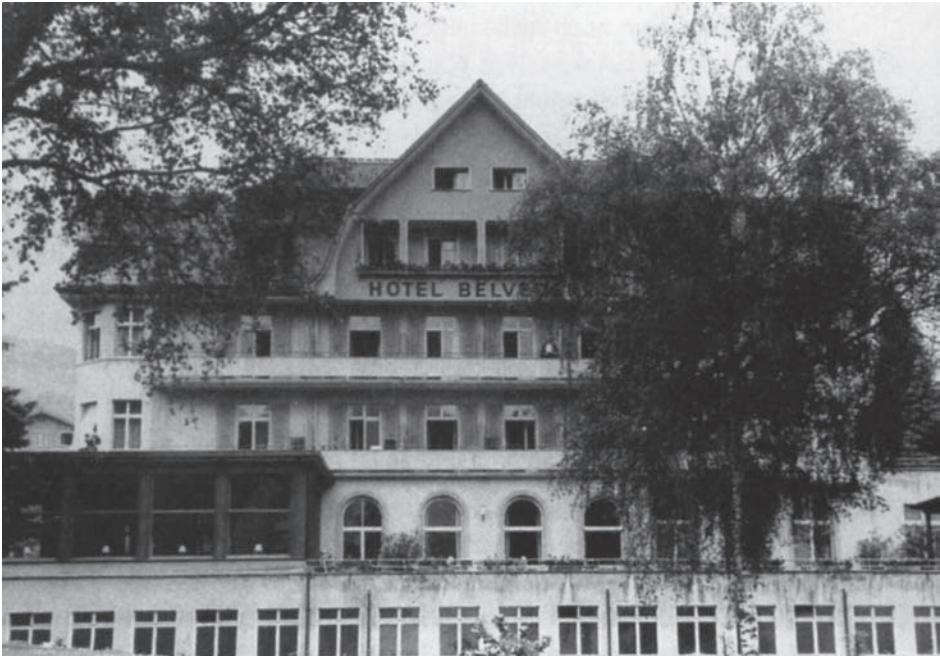
Hotel Belvedere in Spiez

und hatte beim letzten Besuch »sehnstchtig nach den Aussichten unserer N.-Elf in der Schweiz gefragt«. Auch in seinem Namen uerte der Sohn eine groe Bitte: »Knnen Sie mir, Herr Herberger, von der Weltmeisterschaft eine Karte von Ihnen und den Spielern unterschrieben senden.« Er wisse bestimmt nicht, »welche Freude damit viele Kilometer entfernt, nicht weit von der Oder entfacht wird«. 1 Als die Karte einige Wochen spter eintraf, war die Freude kaum noch zu bremsen, denn in der Zwischenzeit war etwas ganz Unerwartetes passiert: Die deutsche Mannschaft war Weltmeister geworden.